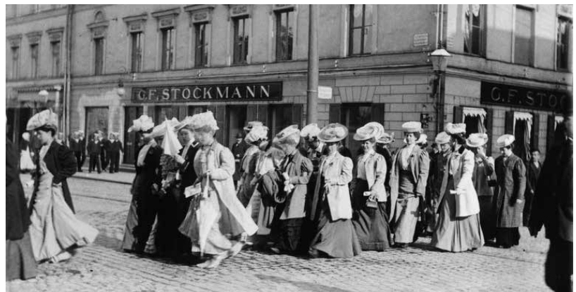
Naisten mielenosoitusmarssi mahdollisesti äänioikeuden puolesta 1905.

Porvarissäätö edusti vuoteen 1879 asti kaupunkien veroa maksavia porvareita ja muita privilegioituja ammatinharjoittajia. Vanhan ammattikuntajärjestelmän lakkauttamisen jälkeen porvarissäädyn vaaliin saivat osallistua – eräin poikkeuksin – kaikki kaupunkien muihin säätyihin kuulumattomat miespuoliset veroa maksavat asukkaat. Äänioikeuden sidonnaisuus veroäyrihin vaikutti kunnallisvaalien tapaan myös porvarissäädyn edustajien vaalissa.