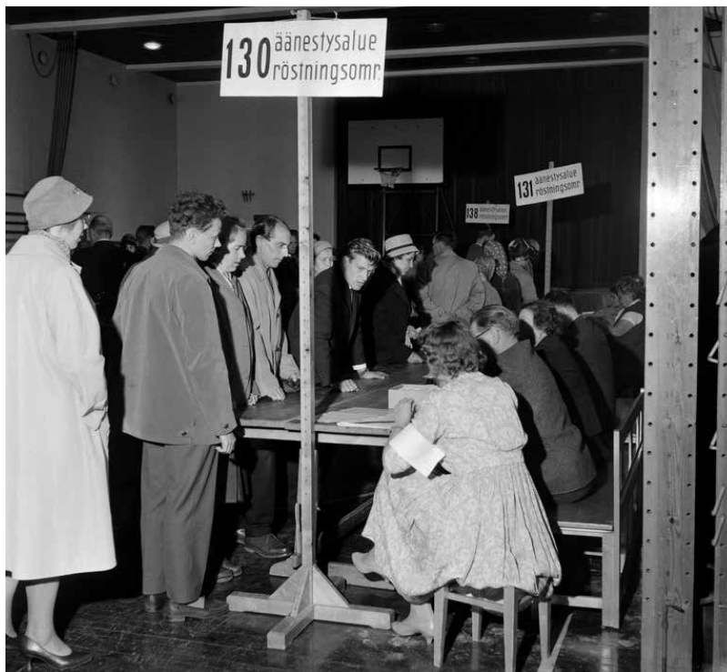
Kunnallisvaalit 2.10–3.10.1960 Herttoniemen kansakoulussa.

Oikeus valita valtuutettuja oli jokaisella kunnan jäsenellä, sekä miehellä että naisella, jolla oli Suomen kansalaisoikeus ja joka ennen vaalivuoden alkua oli täyttänyt 20 vuotta. Lain mukaan vaalikelpoisuutta vailla olivat holhouksen alaiset, kansalaisluottamusta vailla olevat sekä vaaleissa ääniä ostaneet ja myyneet. Kunnallisten verojen maksuun tai muita varallisuusasemaan liittyviä rajoituksia laki ei sisältänyt. Vaalikelpoinen valtuutetuksi ja kunnan muihin luottamustoimiin oli jokainen kunnassa asuva henkilö, joka on oikeutettu valtuutettuja valitsemaan.